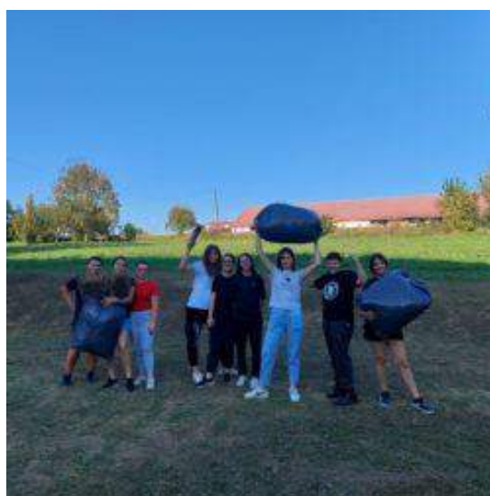
Slika 5: Projekt "Najljepši školski vrtovi"