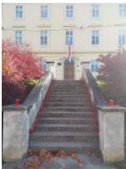
Slika 9: Paljenjem lampaša ispred prostora Doma obilježili smo Dan sjećanja na žrtve Domovinskog rata i Dan sjećanja na žrtvu Vukovara i Škabrnje