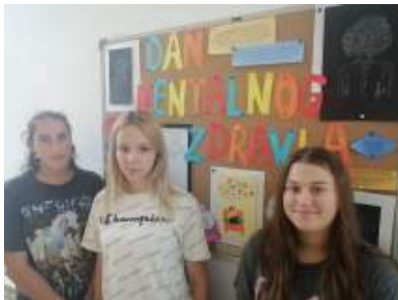
Slika 7: Obilježavanje Dana mentalnog zdravlja – Novinarska grupa