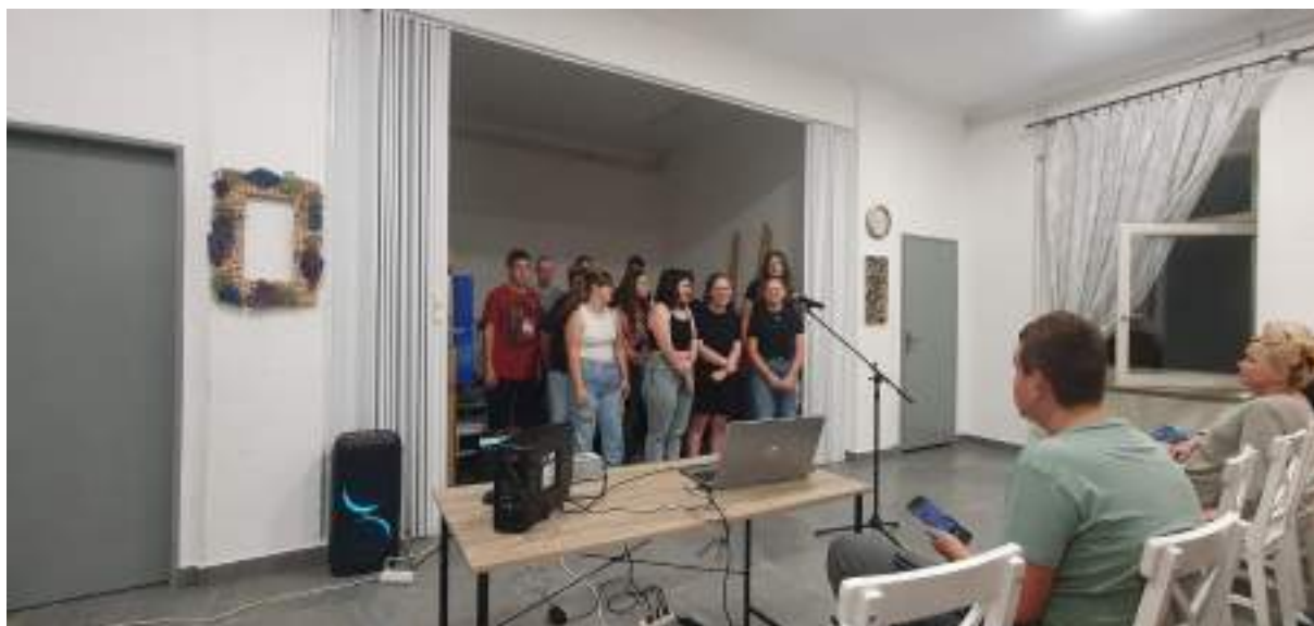
Slika 3: Priredba dobrodošlice za prve razrede