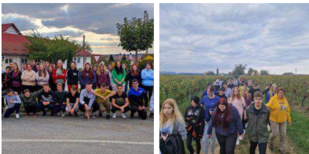
Slika 8: Svjetski dan pješaćenja