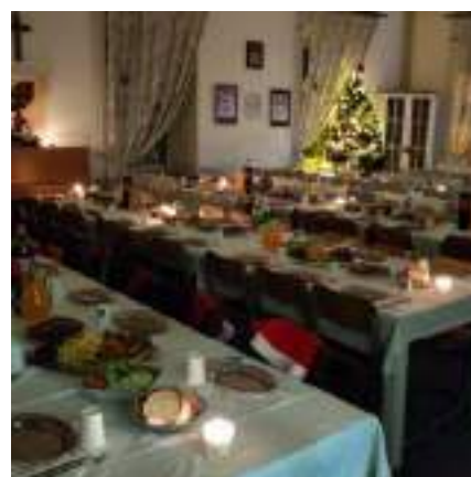
Slika 21: Božićna priredba i večera