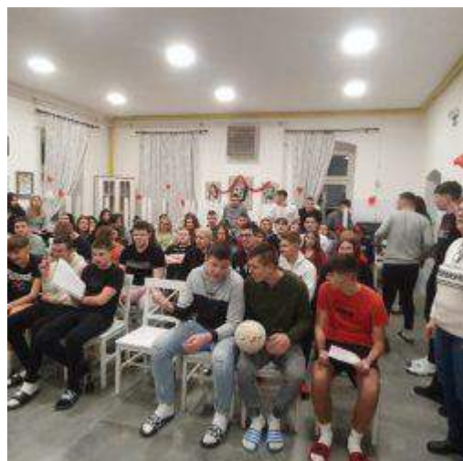
Slika 24: Valentinovo