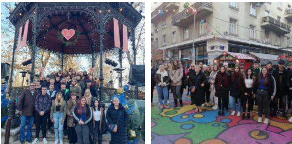
Slika 19: Advent u Zagrebu