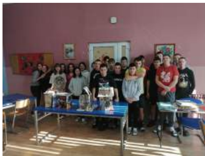
Slika 20: Radionica „Život u grupi i timski rad“