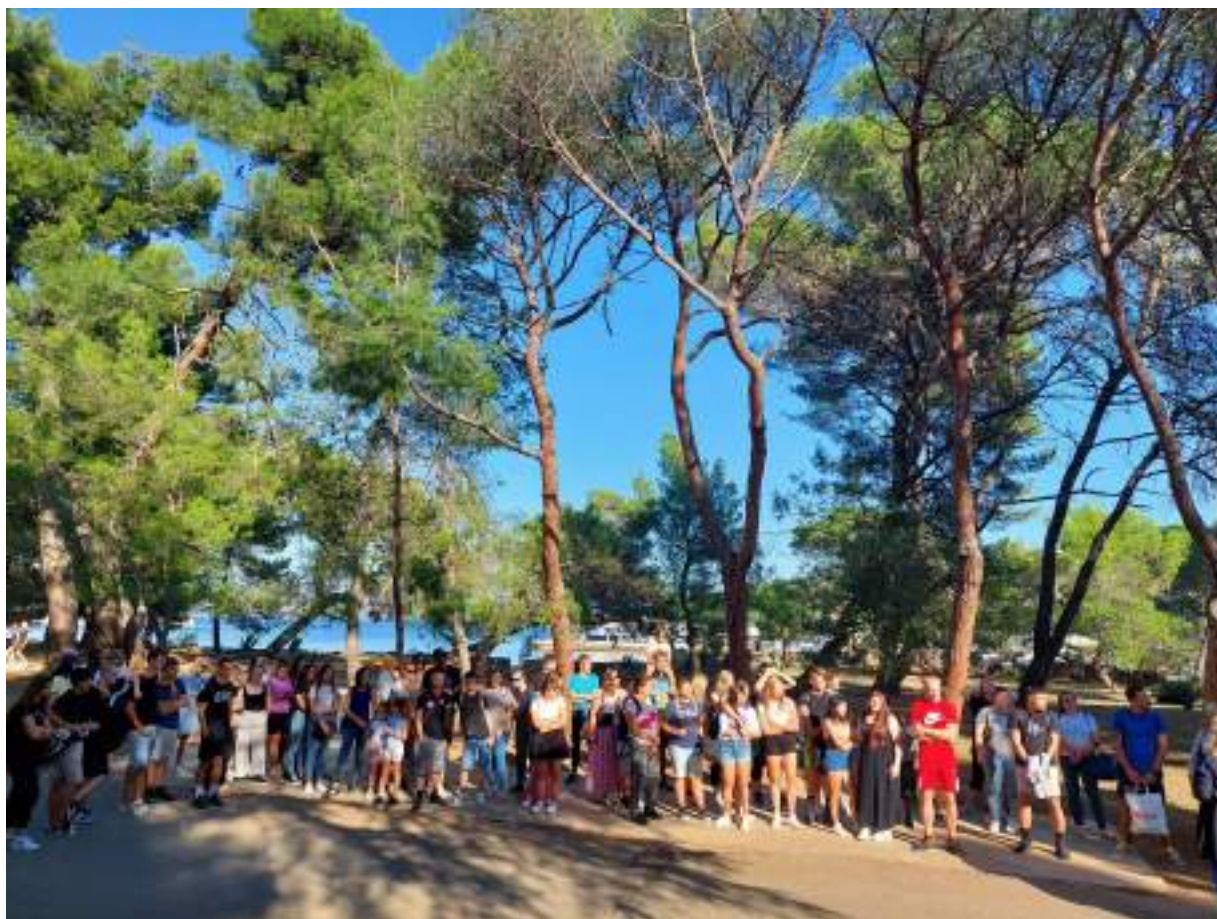
Slika 4: Izlet u Nacionalni park Brijuni