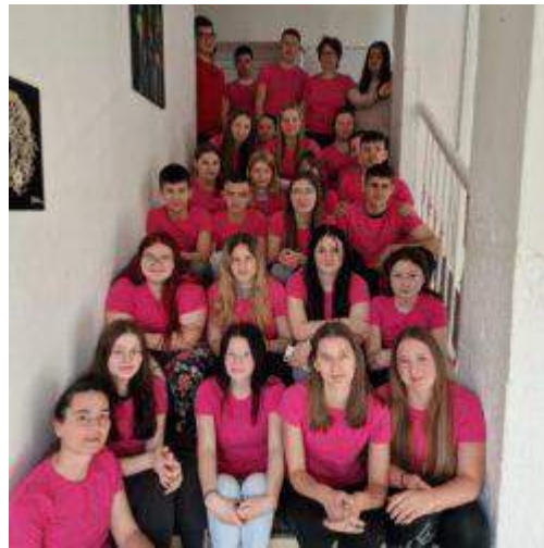
Slika 26: Dan borbe protiv vršnjačkog nasilja