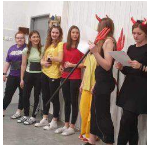
Slika 23: Fasnik u Učeničkom domu Križevci