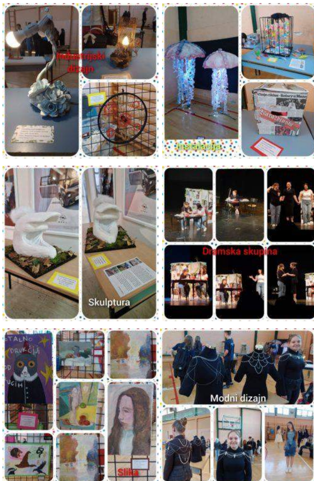
Slika 30: Regionalna Domijada u Varaždinu