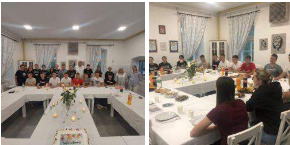
33: Ispraćaj maturanata