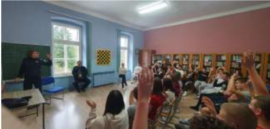
Slika 10: Predavanje „Cyberbullying – opasnosti na društvenim mrežama“ – predavači iz Policijske uprave koprivničko-križevačke